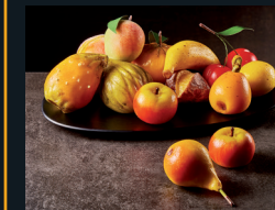
FRUTTA DI MARTORANA 92