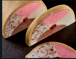
TORRONE DI CAMPAGNA 114