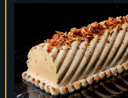
SEMIFREDDO ALLE MANDORLE 146