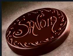
TORTA SAVOIA 68