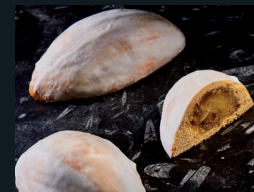
PANTOFOLA DI LERCARA FRIDDI 178