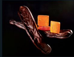
CARAMELLE ALLA CARRUBBA 116