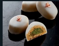
CUCCHITEDI DI SCIACCA 170