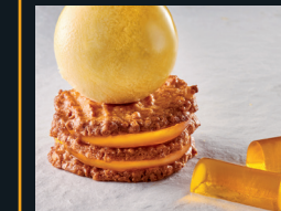
BOULE AL MANDARINO 226