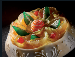
CASSATA SICILIANA 62