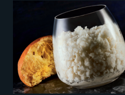
GRANITA ALLE MANDORLE 134