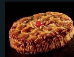
TORTA DELIZIA 76