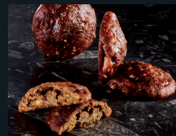
TIRIMULLURI DI RANDAZZO 172