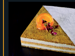
PROFUMO DI ZAGARA 220