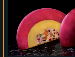
PEZZETTO CON FRUTTI DI BOSCO E MANGO 142