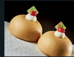
MINNI DI VERGINE 56