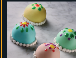
DOLCI DA RIPOSTO 108