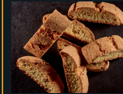
BISCOTTI ALL'ANICE 104