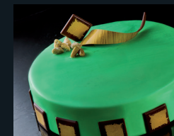
ORO VERDE 191