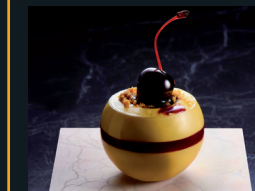
MA CHÉRY 214