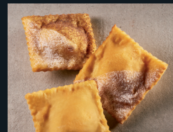
PANELLE DOLCI 52