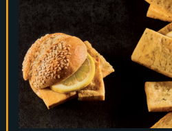
PANELLE PALERMITANE 164