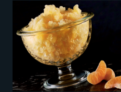
GRANITA AL MANDARINO 136