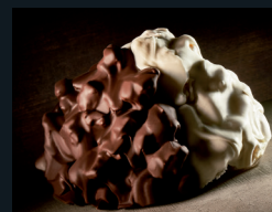
PIGNOLATA DI MESSINA 174