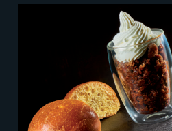
GRANITA AL CAFFÈ CON PANNA E BRIOCHE 138