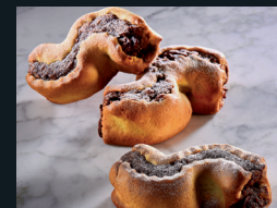
CIASCUNA DI SIRACUSA 180