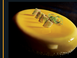
RAPSDIA AL LIMONE 202