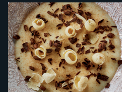
BIANCOMANGIARE ALLA MANDORLA 79