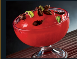
GELO DI ANGIURIA IN COPPA 80