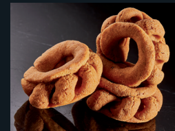
CUDDRIREDDRI DI DELIA 176