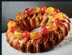
CUCCIDATU O BUCELLATO 70