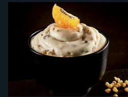
CUCCIA CON CREMA DI RICOTTA 74