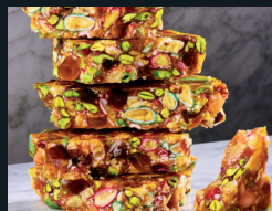
PETRAFENNULA CON CONFETTI 120