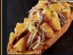
INSALATA DI ARANCE 156