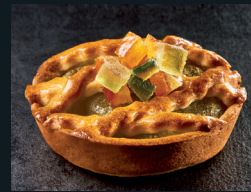
MARIA STUARDA 39