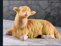
PECORELLE PASQUALI DI PASTAREALE 122