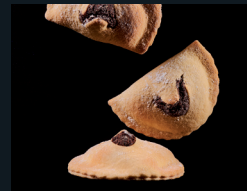
'MPANATIGGHI DI MODICA 168