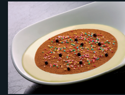
TESTA DI TURCO 72