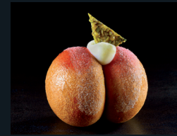
PESCHE CON CREMA DI RICOTTA 54