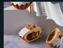
BUCCONETTI DI ENNA 182