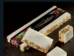
TORRONE SICILIANO 126