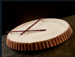
CASSATA AL FORNO 66