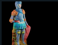
PUPI DI ZUCCHERO 118