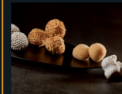
DOLCETTI ALLE MANDORLE 89